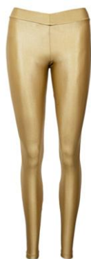
Figura 3 - Legging cirrê dourada