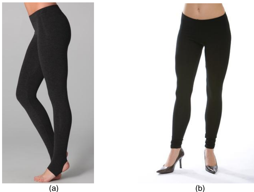
Figura 1 - Calça fuseau (a) e calça legging (b)

De acordo com Moraes (2007), o termo legging é recente, derivado da fuseau – calça justa e afunilada, cuja linha lembra um fuso – que é originária da meia. A diferença entre as calças fuseau e a legging é que na primeira, as pernas tem uma alça de união que fica na sola do pé (FIG. 1a), enquanto a legging (FIG. 1b) tem o comprimento das pernas até o tornozelo.