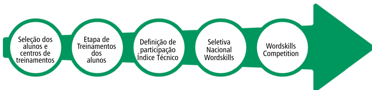
Figura 1.1 - Etapas de Competição

A Figura 1.1 demonstra o processo de seleção e preparação definido pelo Departamento Regional do Rio Grande do Sul, para participar da Seletiva Nacional da WorldSkills - Olimpíada do Conhecimento, visando a Worldskills Competition.